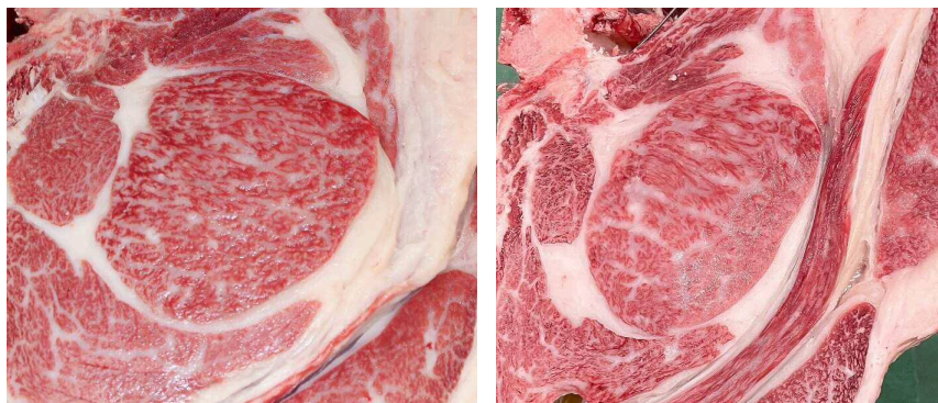
去勢、ロース芯面積 83 cm 2 、BMSNo.12 奥華栄-茂勝栄-藤桜