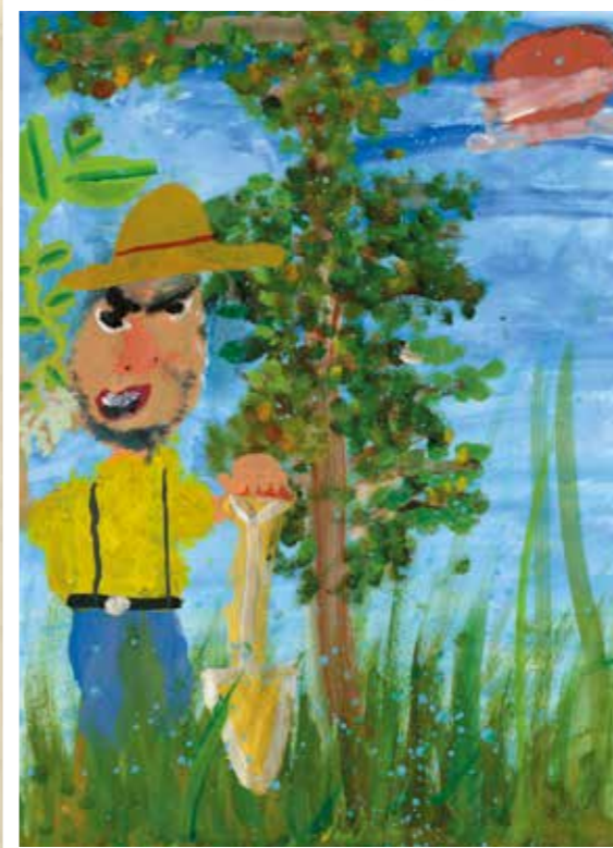
「未来のためにはじめよう!」