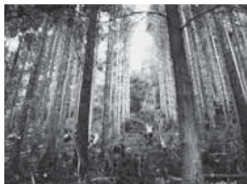
列状に間伐された林分 隠岐の島町

「列状間伐」は、間伐が必要なスギやヒノキ林で一定の間隔で伐採する列を決め、その列に沿って間伐する方法です。伐採する列は、植栽列ごと、また一定の距離ごとに設定し、列幅は、木の生育状況や密度を考慮して決定します。各立木の形質にかかわらず列状に伐採するため、高性能林業機械を組み合わせた機械化作業に適した間伐方法であり、効率的に伐採・搬出できます。