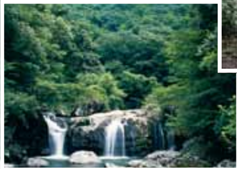
森林は私達が飲む水の源です。