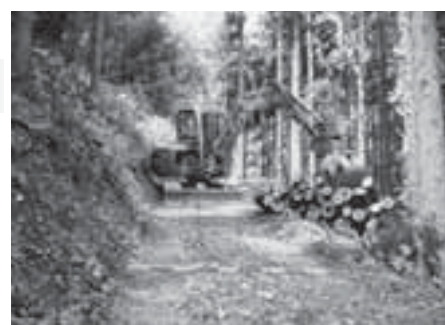
路網の整備は不可欠 益田市美都町

低コストで効率的な利用間伐を進めていくために、列状間伐は有効といえそうです。しかし、その実施にあたって、作業システムや集材方法などを上手く組み合わせて実施していくことが作業効率を向上させるためには重要です。また、間伐対象林分の林況や林道・作業道等搬出路の整備状況等を把握しながら、利用のための列状間伐を進めていく必要があります。