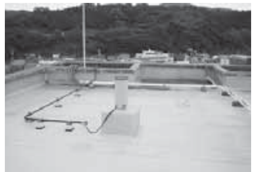
浜田観測局（雨量計）