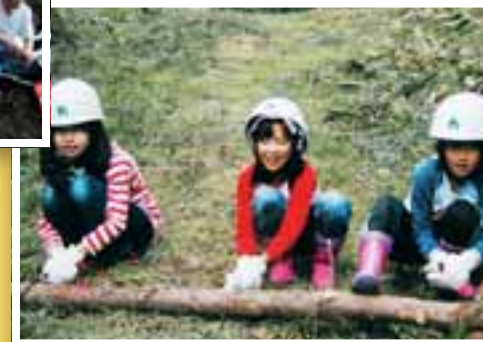
森林は木材の供給源です。