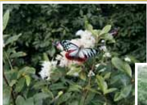
森林はたくさんの生き物のすみかです。