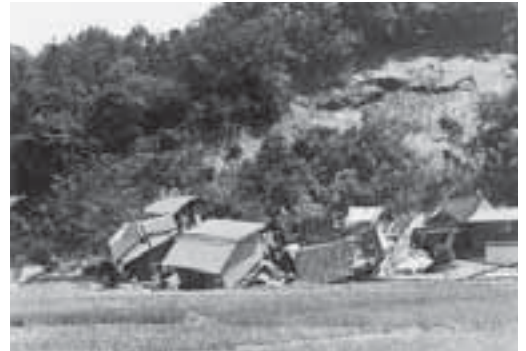
集中豪雨による山崩れで一瞬のうちに倒壊した家屋

■災害はいつ襲って来るかわかりません。尊い生命や貴重な財産は失われたら元に戻すことはできません。皆さんも、たまには家の周りを点検したり、大雨の時には天気予報に耳を傾けるなど、日頃から災害に対する準備と心構えをしておいてください。