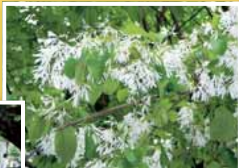
森林は空気をきれいにします。