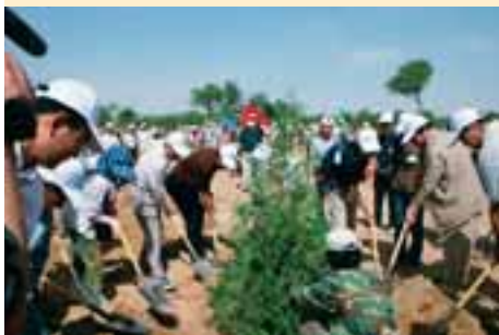
友好林での植樹活動

そこで、島根県は平成10年度に「寧夏緑化国際協力事業」を創設し、毎年200万円（この内100万円は緑の募金公募事業を活用）を拠出して、平成18年度までの9年間で42haの友好林造成に取り組んだところ。この事業の10年間の成果について寧夏政府は非常に高く評価しており、植林会場に掲示してあった説明パネルには、「造成面積48ha、植栽本数9万本、参加者数は日本友人や各界の専門家など延べ3万3千人、総投資額260万円（約3900万円）、これは国家林業局や自治区政府がこの計画を高度重視し支持してきた結果である。県民交流団の植林活動の様子は、その都度、国内外のメディアで広く報道されており、今後も国を超えた環境保全活動としてモデル効果があると確信している。」と記されています。