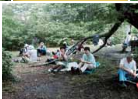
森林は心のふるさとです。