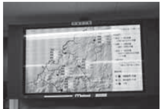
浜田監視局（市役所）