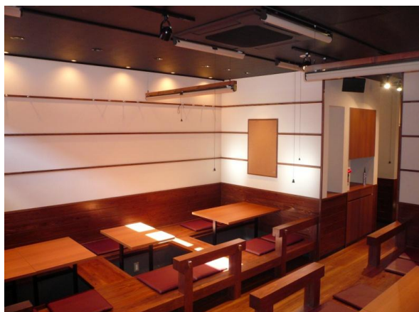
内観（小上がり席） （床：杉フローリング、腰壁：杉羽目板）