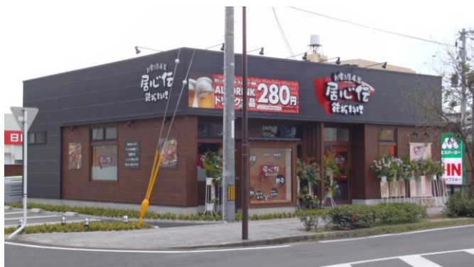
外観 （外壁：杉羽目板）