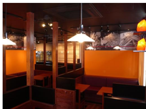
内観（ボックス席） （柱：杉、腰壁：杉羽目板）