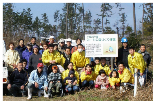
平成25年度みーもの森づくり事業（出雲市）

・第1期 160件 61,491人 ・第2期 111件 53,638人（～H25末現在）