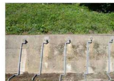
地下水排除工 (地下水の排除：水抜きボーリング)