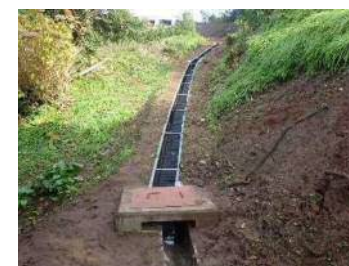
地表水排除工 (表面水の地下浸透を防ぐ：排水路)