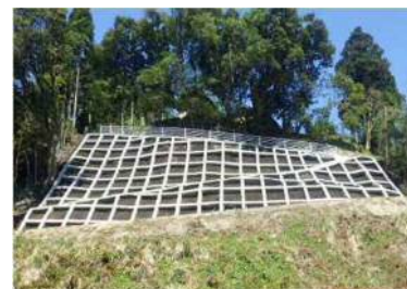
排土+法枠 (土砂を除去し斜面の安定を図る)