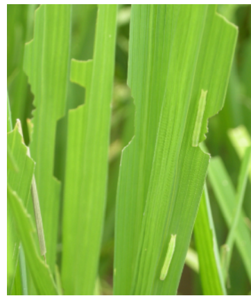
図4 .食害の状況（幼虫）

幼虫は緑色で約2センチくらいまで成長します。ふ化直後の幼虫は葉の表面をカスリ状に、3齢以降は葉の縁から階段状に食害します。