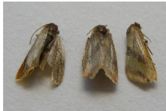
図2 .成虫：体長 6～8mm、 8～10mm