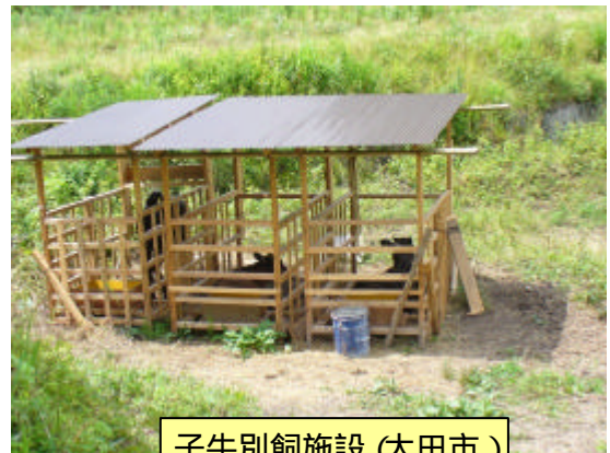
子牛別飼施設(大田市)