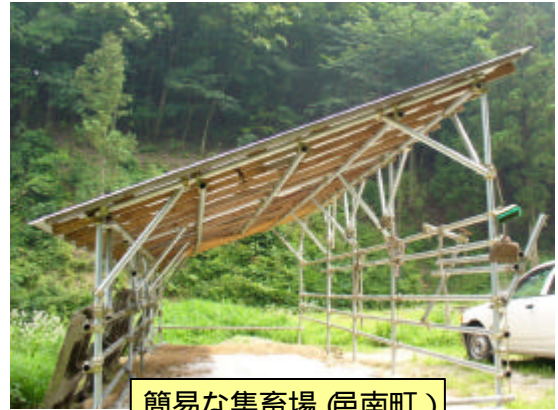
簡易な集畜場(邑南町)