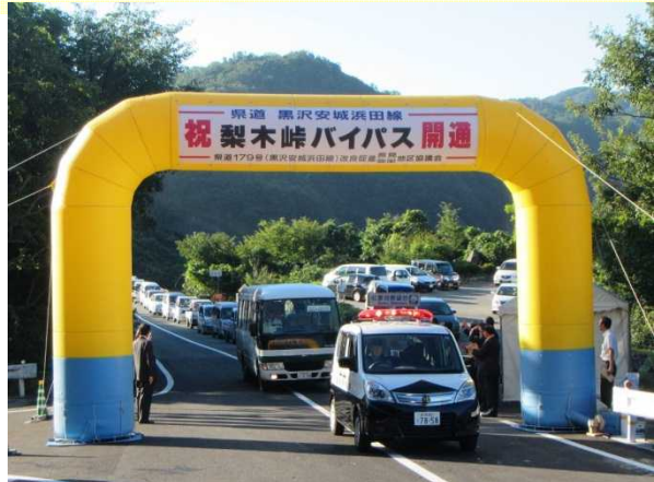
渡り初めの状況（H27.8.27AM7:00頃）