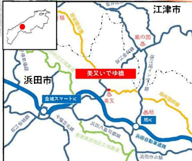
美又温泉 石畳および足湯