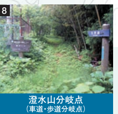
澄水山分岐点 (車道・歩道分岐点)