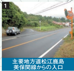
主要地方道松江鹿島美保関線からの入口