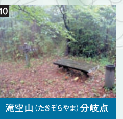
滝空山(たきぞらやま)分岐点