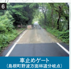
車止めゲート (島根町野波方面林道分岐点)