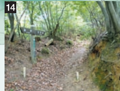
14 講武(こうぶ)方面分岐点

県道松江島根線(通称加賀線)最長の新道トンネルの南口の脇にある階段から出入する。歩道がないので通行注意。駐車スペースなし。