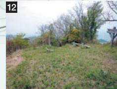
12 大平山(おおひらやま)山頂

交差点部に駐車スペースがあり、送迎車は東持田町の平成ニュータウン北側の林道澄水山線又は、松江鹿島美保関線の御津から進入する。