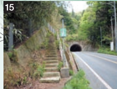
15 新道(しんみち)トンネル登り口 (車道・歩道分岐点)

上講武入口バス停すぐ。駐車スペースなし。この先、朝日山方面へ進む場合は、県道の下をアンダーパスで横断し、車道に沿って西方向へ進む。