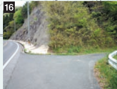
16 新道(しんみち)トンネル南口交差点 (枕木山・大平山モデルコース起終点)

上講武入口バス停すぐ。駐車スペースなし。この先、朝日山方面へ進む場合は、県道の下をアンダーパスで横断し、車道に沿って西方向へ進む。