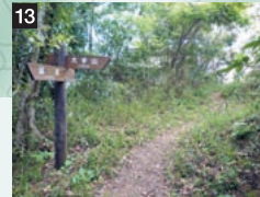
13 林道出会 (持田方面・御津方面分岐点)

交差点部に駐車スペースがあり、送迎車は東持田町の平成ニュータウン北側の林道澄水山線又は、松江鹿島美保関線の御津から進入する。