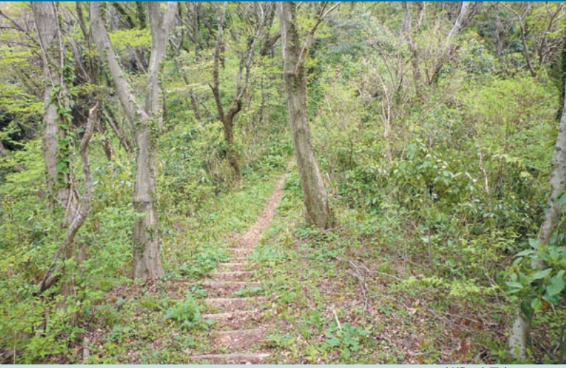
新緑の大平山コース

中国自然歩道 美保関・大平山コース 美保関・大平山コースは、境水道大橋から、日本海の海岸線と島根半島の稜線部である松江北山をたどりながら、松江市鹿島町の朝日山登山口に至る延長約41.1kmの区間で、島根半島東部の海と山を併せ楽しむことのできるコースです。