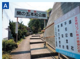
A 五本松公園入口 海沿いの県道から分かれて、五本松公園まではつづら折の急坂。駐車場あり。