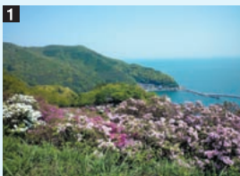
1 関の五本松・五本松公園 標高100メートルほどの丘陵上にある。民謡にも歌われ、かつて美保関港を往来する船の目印としての役割を担っていた。現在、一帯が公園として整備されている。また約5000本のツツジが植えられており、ツツジの名所としても知られている。