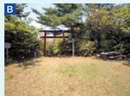
B 五本松公園 園地の北側にある鳥居をくぐると、歩道が続いている。公園内には東屋もある。