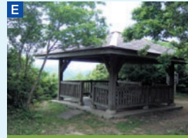
E 東屋 標高190m地点から弓ヶ浜半島方面を望むことができる。