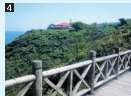
4 地蔵崎園地 地蔵崎園地からは、大山の稜線から昇る日の出や日本海に沈む夕日を見ることができ、見通しのいい日には隠岐島を望むこともできる。南側の照葉樹林内には、植物を観察しながら周回できる自然観察路が整備されている。