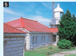
5 美保関灯台 島根半島の最東端・地蔵崎にある。明治31年に建設された山陰地方最古の灯台である。「世界の歴史的灯台100選」にも選定されている。隣接する石造りの旧職員宿舎は、現在はビューフェとして使われており、食事を楽しむことができる。