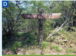
D 馬着山 標高210m。五本松地蔵崎線歩道の最高地点。