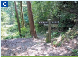
C 十字路 仏谷寺から才方面へ抜ける山道と交差している。野外卓、ベンチが整備されている。