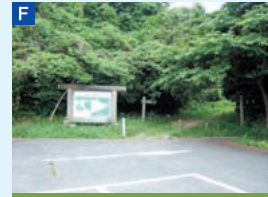
F 地蔵崎園地駐車場 五本松地蔵崎線歩道の到着点にある。トイレも整備されている。