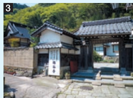
3 仏谷寺 後鳥羽上皇や後醍醐天皇が隠岐に配流されるときに行在所となった寺。門を入って右手の大日堂(だいにとどう)には、国の重要文化財である薬師如来像など5体の仏像が安置されている。