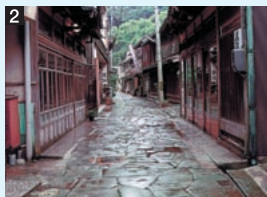
2 青石畳通り 美保神社前から仏谷寺まで続く通り。美保関港は、江戸時代、北前船の風待ち港として栄え、この辺りは廻船問屋が軒を連ねた。海産物等の積み下ろしの作業の便を考え、青石が敷き詰められた。