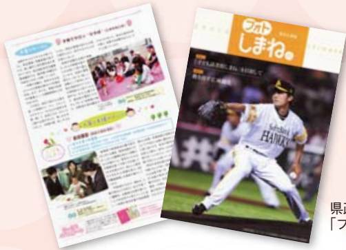
県政広報誌 「フォトしまね」