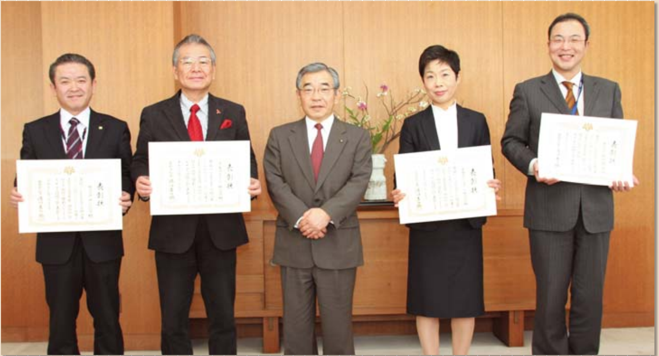
左から、さんびる、フジキコーポレーション、溝口知事、菱農エンジニアリング、島根富士通