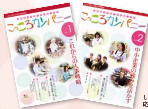
しまね子育て 応援企業情報誌

今後も、多くの企業に「こころカンパニー」になっていただくことにより、働き方の見直しや仕事と生活の調和（ワーク・ライフ・バランス）の推進を図っていきます。