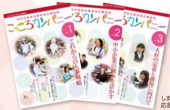
しまね子育て 応援企業情報誌

県は、こころカンパニーを広くPRするとともに、県の中小企業融資制度や入札制度で優遇措置を講じています。今後も、多くの企業に「こころカンパニー」になっていただくことにより、働き方の見直しや仕事と生活の調和（ワーク・ライフ・バランス）の推進を図っていきます。