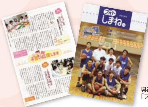
県政広報誌 「フォトしまね」