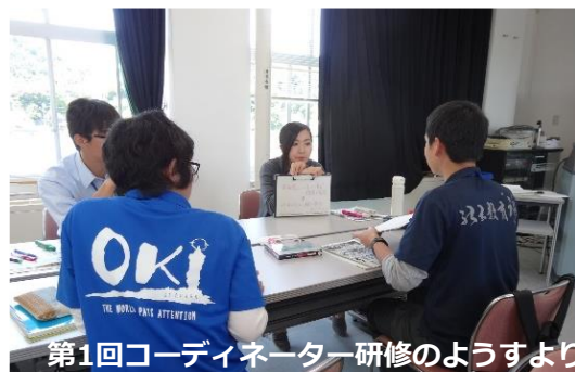
第1回コーディネーター研修のようすより