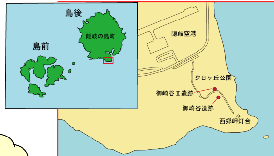
御崎谷遺跡の位置