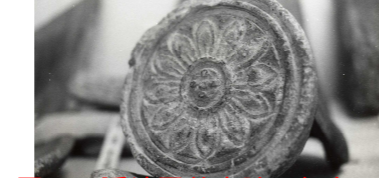
図2 隠岐国分寺跡の軒丸瓦

国分寺と国分尼寺の屋根には瓦が葺かれていました。奈良時代に瓦を葺いたのは寺院や役所などの特別な建物だけでした。当時の葺き方は、平瓦と丸瓦を交互に重ねる「本瓦葺き」でした。（左上の写真）瓦の先端には模様の付いた瓦を配置して軒先を飾っていました。図2、4は、隠岐国分寺跡と隠岐国分尼寺跡で見つかった丸瓦の先端に配置される「軒丸瓦」で、蓮の花の文様が描かれています。