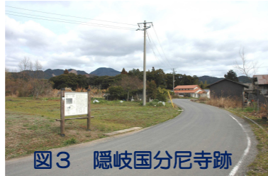
図3 隠岐国分尼寺跡