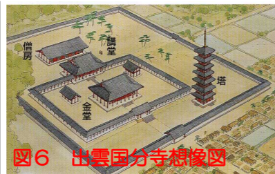
図6 出雲国分寺想像図

国分寺や国分尼寺には、金堂、塔、僧坊、講堂などの建物が建てられていました。金堂は仏像を安置する中心的な施設、塔は仏舎利を奉る施設、僧坊は僧侶の住まい、講堂は僧侶が勉強する施設です。この他にも、鐘をつく鐘楼、経典を納める経蔵、食堂などがありました。国分寺は、瓦がきらめく巨大な建物が立ち並ぶ、当時の最先端の施設だったのです。