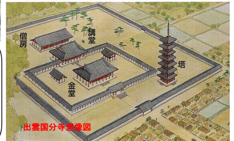
出雲国分寺想像図

② 左下の写真は、隠岐国の役所で使われたと伝えられているものです。何に使われたと思いますか。