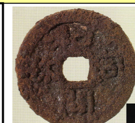
和同開珎銀銭 (左はX線写真→)