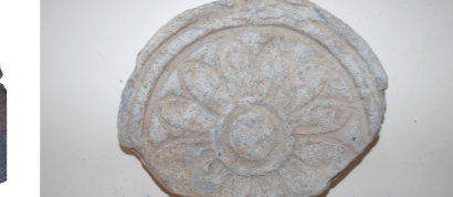
図4 隠岐国分尼寺跡の軒丸瓦