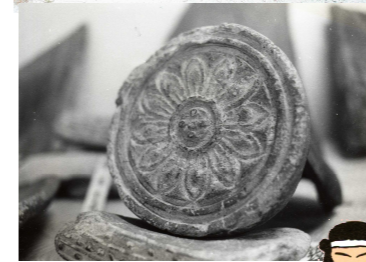
軒丸瓦(隠岐国分寺跡出土)