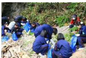
ビーチクリーン ワークショップで楽しみながら、海岸清掃！