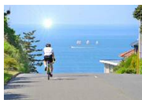
西ノ島サイクリング 秋の爽やかな風の中、摩天崖を駆け抜ける！