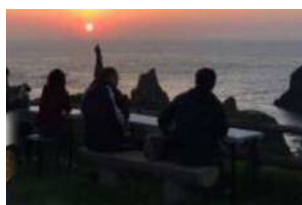
夕日カフェ 観音岩にかかる夕日を見ながら ティータイム♪