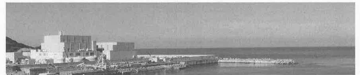
敷地東側からの全景