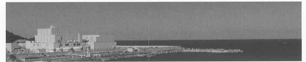
敷地東側からの全景