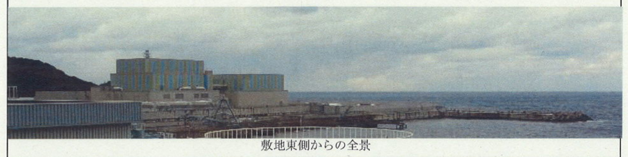
敷地東側からの全景