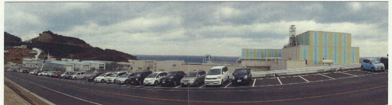
敷地南側からの全景