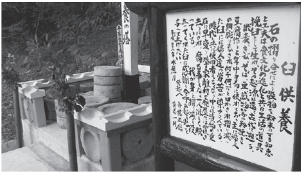
写真2 石臼供養塚と案内板