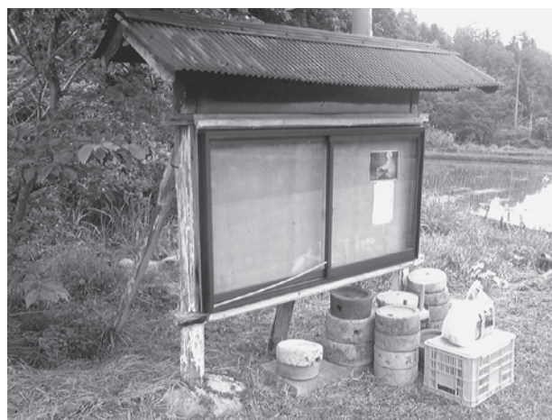
写真1 集会所前に積まれた石臼

「石臼供養」は、弥栄自治区に暮らすある古老が、供養の当日に安城地区の公民館（以下、安城公民館）を訪れ、石臼の話をしたことに始まった。その場に居合わせた公民館関係者、及び筆者ら地域外部の人間が、急遽、石臼供養に参加することになったのである。