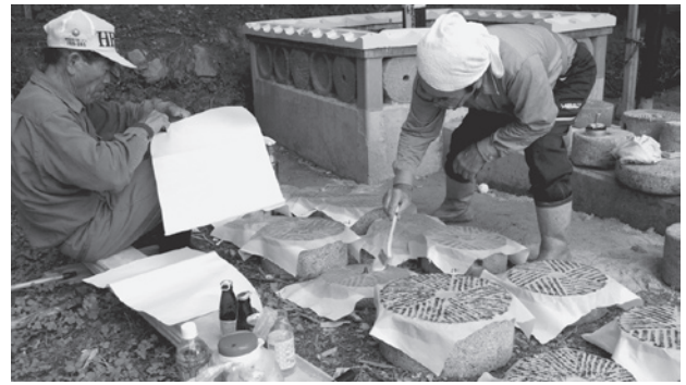
写真3 記録作業（実測・拓本とり）の様子