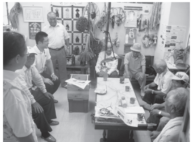
写真6 安城公民館の日常の様子

山陰・北陸地域の公民館は、小学校区の単位など、歴史的なつながりや地域住民が連携し合える距離に設置されているというメリットを持ち、地域の拠点施設としてまちづくりに向けて取組みが行いやすい地理的・社会